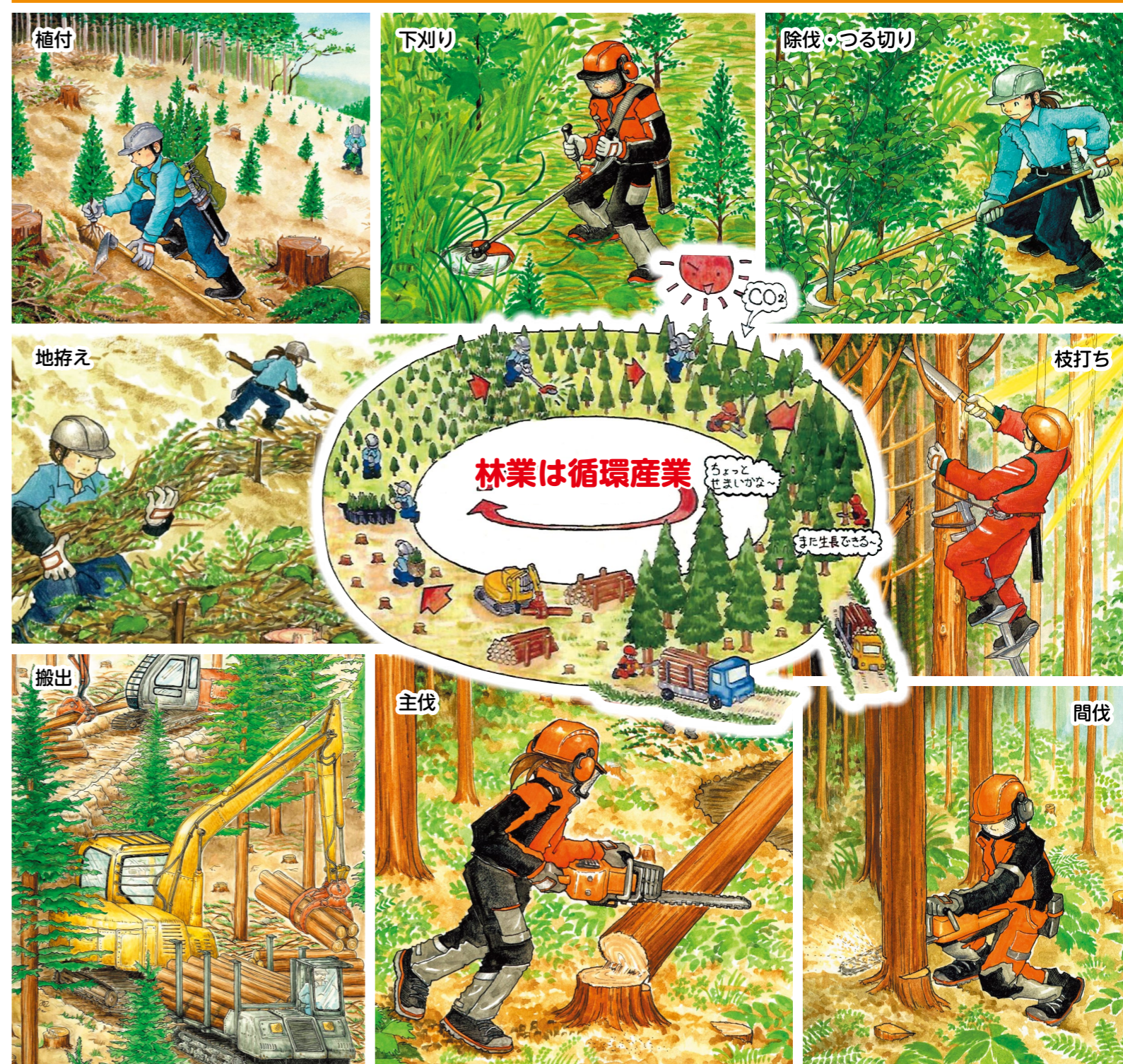
協力：林野図書資料館、イラスト：平田美紗子

専門的かつ高度な知識・技術・技能を有し、森林施業を効率的に行える現場技能者の育成に取り組む林業経営体を応援します。