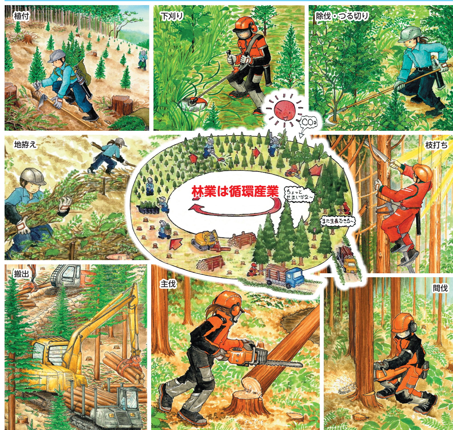
協力：林野図書資料館、イラスト：平田美紗子

専門的かつ高度な知識・技術・技能を有し、森林施業を効率的に行える現場技能者の育成に取り組む林業経営体を応援します。