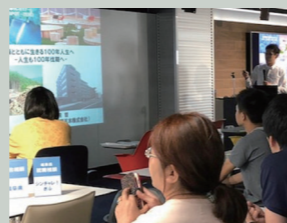
清流の国ぎふ暮らしセミナー「森を育て活かす暮らし。」