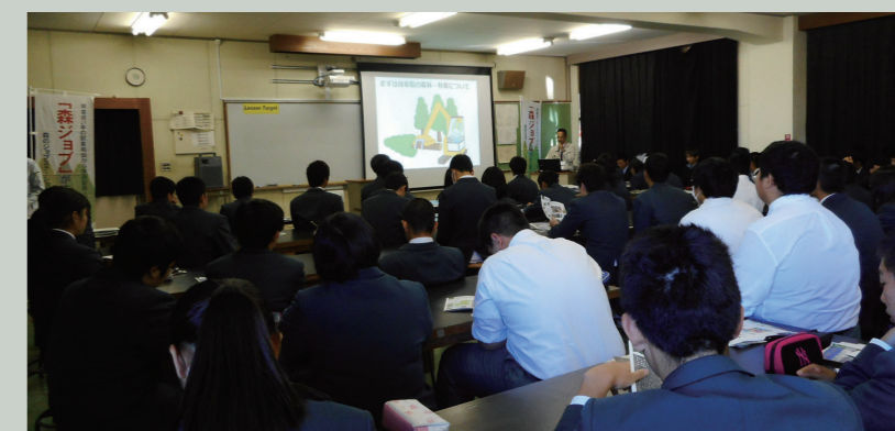
森ジョブスカウト