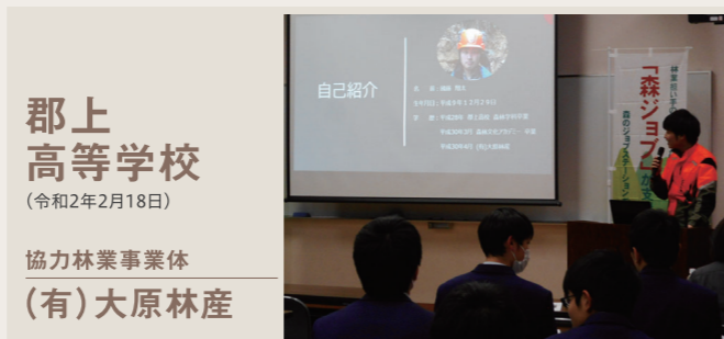
郡上高等学校 (令和2年2月18日) 協力林業事業体 (有)大原林産