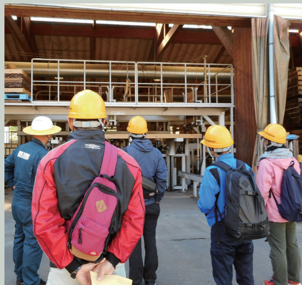
林業体感・見学セミナー（木材流通編）