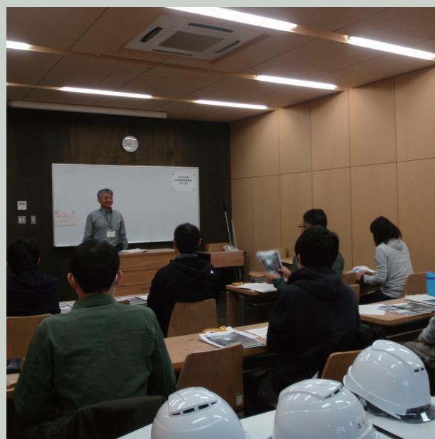
林業就業支援講習（厚生労働省委託事業）【上半期】