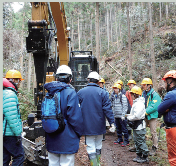
林業体感・見学セミナー（森林施業編）