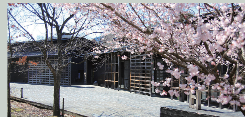
森林文化アカデミー