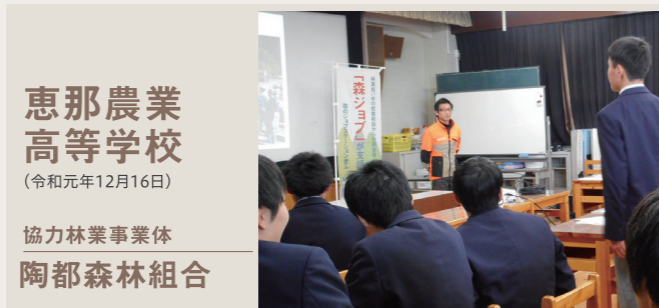
恵那農業高等学校 (令和元年12月16日) 協力林業事業体 陶都森林組合