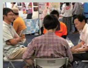
《移住》井戸端会議in東京