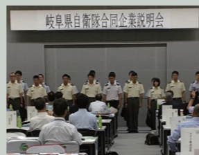
岐阜県自衛隊合同企業説明会