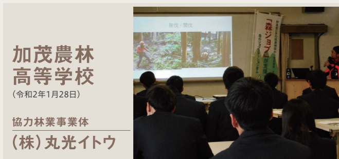
加茂農林高等学校 (令和2年1月28日) 協力林業事業体 (株)丸光イトウ