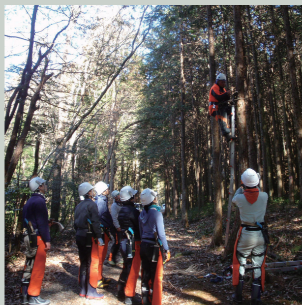
林業就業支援講習（厚生労働省委託事業）【下半期】