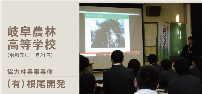
岐阜農林高等学校 (令和元年11月21日) 協力林業事業体 (有)根尾開発

この取り組みは、県内の高校などを巡回して、直接、学生の皆さんにぎふの林業をPRするもので、初年度となった令和元年度は、地域の森林技術者の方々と共に岐阜県内の4つの高校を巡回して、講話や座談会等を実施しました。中には、林業への道に進むと決意している生徒の方もいて、とてもうれしく、心強く思いました。これを機に林業という仕事が職業の選択肢の一つとして、また、学生の皆さんのこれからのため、何か一つでもプラスになれば幸いです。