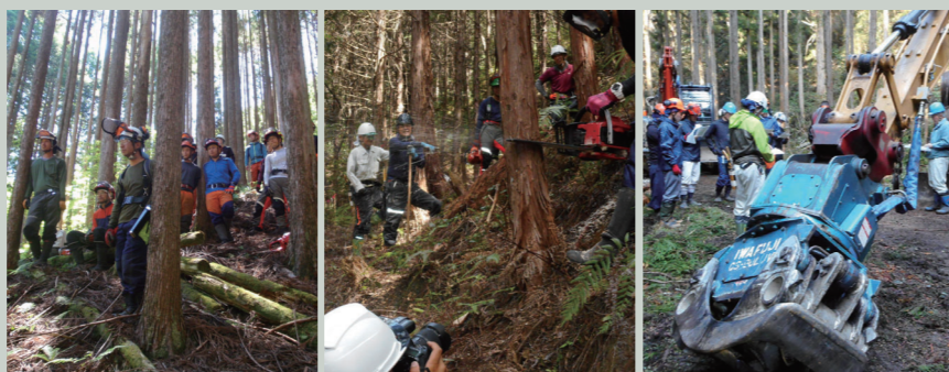
1年目研修 2年目研修 3年目研修