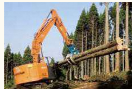
グラップル (集材、仕分)

従来チェーンソーで行なっていた立木の伐倒、枝払い、玉切りの各作業と玉切りした材の集積作業を一貫して行う機械。