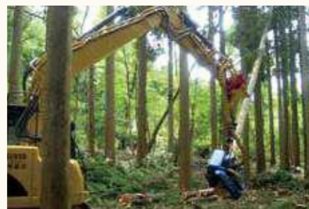
ハーベスタ (伐倒・枝払い・玉切り・集積)

一昔前までの伐採現場というとチェーンソーで伐倒し、索道で搬出が一般的でし随分労働強度が軽減されるとともに効率も良くなってきています。