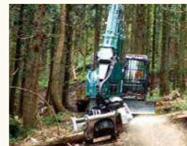
プロセッサ (枝払い・玉切り)

林道や土場などで、全木集材されてきた材の枝払い、測尺、玉切りを連続して行う機械。